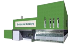
پىشخستنى تەندروستى گشتى و خوشگوزەرانى

دەتوانىت ئەنجومەنى ناوخۆى خۆت بدۆزىتەوہ بە چوون بۆ